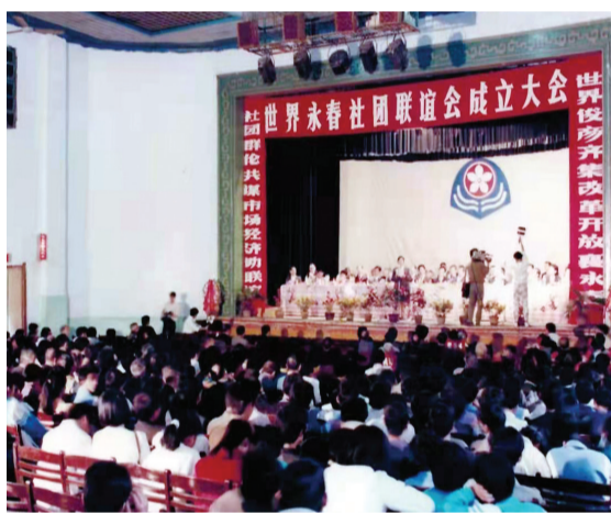
1993年11月，世界永春社團聯誼會在永春隆重成立（資料圖）。